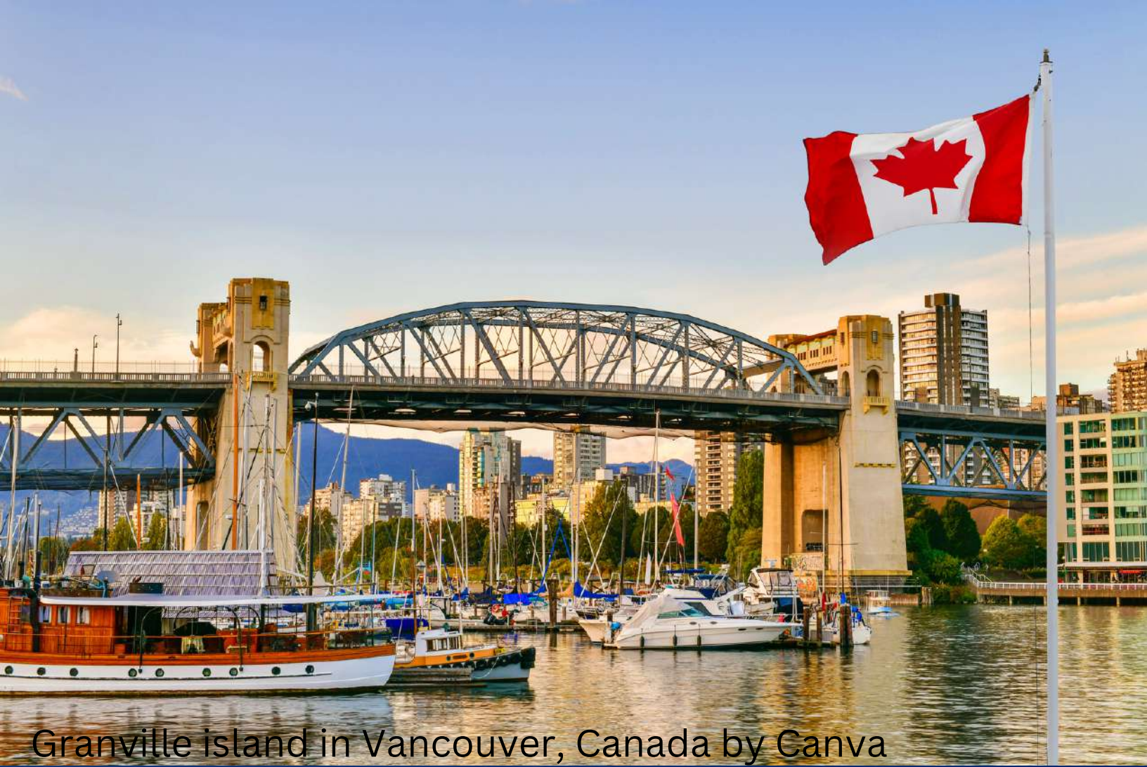
Granville island in Vancouver, Canada by Canva

Arabic English Variety Magazine APRIL 2023 ISSUE 66